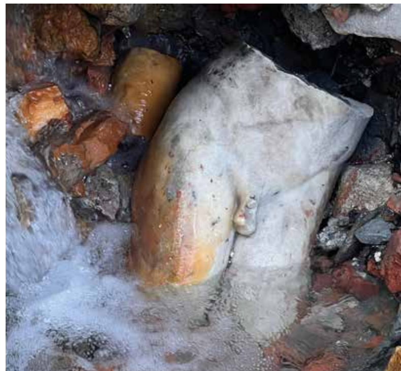
La statua di Apollo emerge dallo scavo