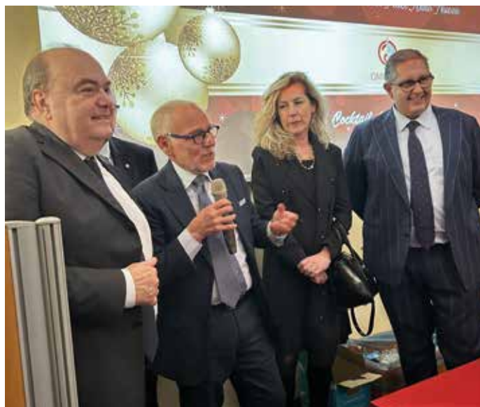
I saluti del Consigliere Regione Liguria Stefano Ballerai