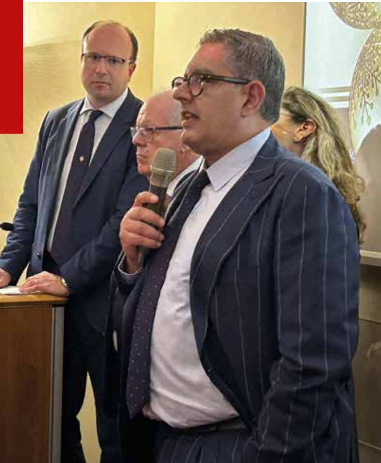
I saluti del Presidente Regione Liguria Giovanni Toti

L'ambientazione festosa ha contribuito alla buona riuscita dell'evento alla presenza delle innumerevoli Autorità Locali