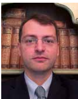
Eugenio Piccardi Studio Associato Giulietti Ragionieri e Dottori Commercialisti

S ul Supplemento Ordinario n.40 alla Gazzetta Ufficiale del 30 dicembre 2023 n.303 è stata pubblicata la Legge n.213 del 30 dicembre 2020 (c.d. Legge di Bilancio 2024). I provvedimenti contenuti nella normativa di cui sopra sono in vigore a partire dal 1° gennaio 2024, di seguito vengono riportate alcune delle novità di maggiore interesse.