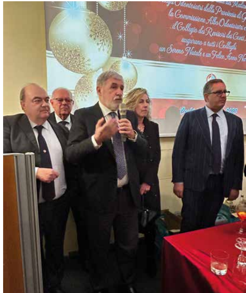
I saluti del Sindaco di Genova Marco Bucci