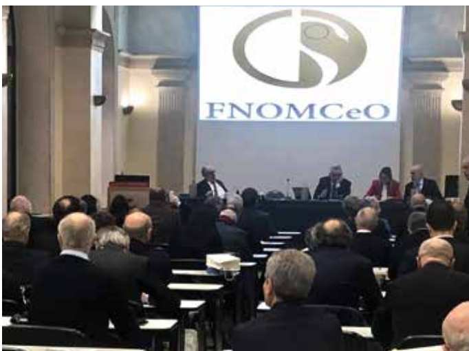
La Platea della CAO Nazionale