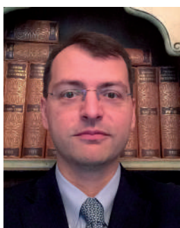
Eugenio Piccardi Studio Associato Giulietti Ragionieri e Dottori Commercialisti

S ulla Gazzetta Ufficiale del 18 novembre 2022 n° 270, è stato pubblicato il D.L. n° 176 del 18 novembre 2022, cosiddetto decreto Aiuti quater. Il decreto interviene con misure di sostegno a cittadini ed imprese, contro l'aumento dei costi energetici, e con modifiche a bonus esistenti, tra cui quelli edilizi.