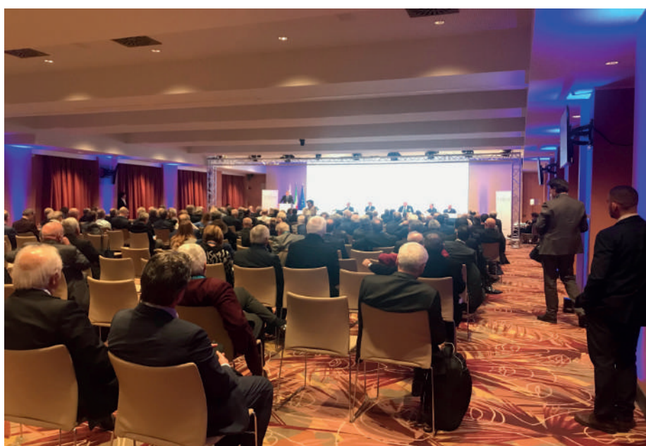
La platea dell'Assemblea all'Hotel Villa Pamphili

Dopo i risultati record degli ultimi anni, con avanzi di gestione sempre sopra il miliardo di euro nonostante il Covid, per l'anno in corso l'ente dei medici e degli odontoiatri stima provvisoriamente un risultato negativo di 564 milioni di euro, che risente degli effetti del conflitto russo-ucraino, dell'esplosione dei prezzi delle materie prime energetiche e alimentari e della conseguente impennata dei tassi d'interesse. La Fondazione non si è avvalsa della norma "salva-bilanci" contenuta nell'ultimo Decreto-Legge Semplificazioni che avrebbe consentito di presentare invece conti in positivo per 800 milioni di euro.