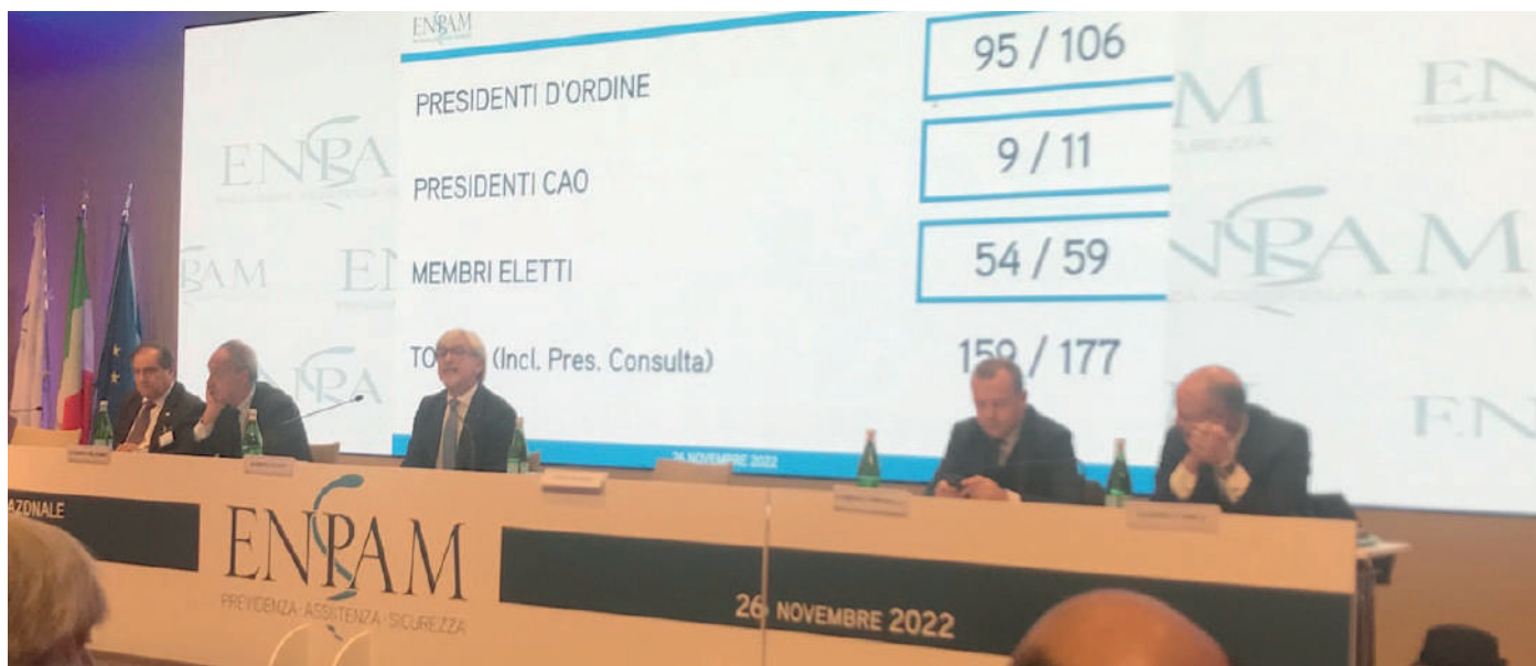
Il podio dell'Esecutivo Enpam