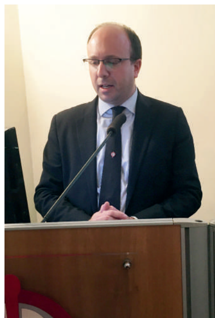
La platea in osservanza dei Colleghi deceduti